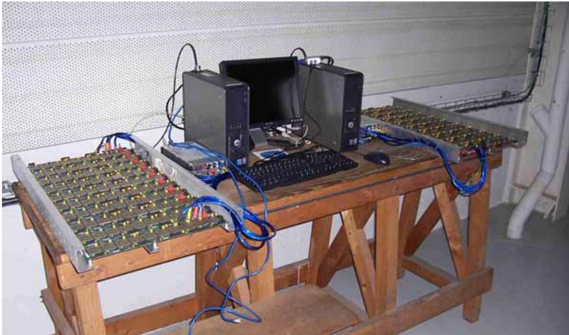
Vue d'ensemble du banc de test ROSETTA installé dans les locaux du L2MP, Bâtiment IRPHE, Technopôle de Château-Gombert, Marseille