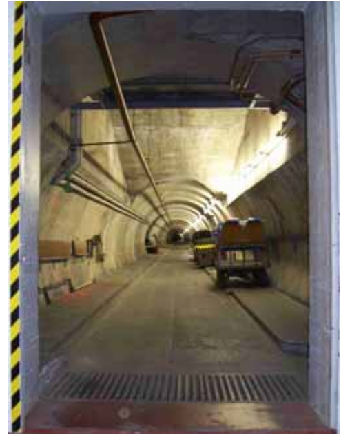
Entrée du LSBB (à gauche) et début de la grande galerie de 1800m de long (à droite) plongeant sous le relief rocheux du Plateau d'Albion.