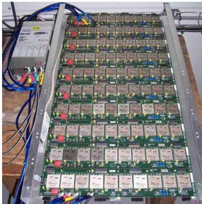
Détail de l'un des deux panneaux de test comportant 100 circuits FPGA Xilinx VirtexII Pro ® : environ deux milliards de cellules mémoires sont ainsi surveillées.