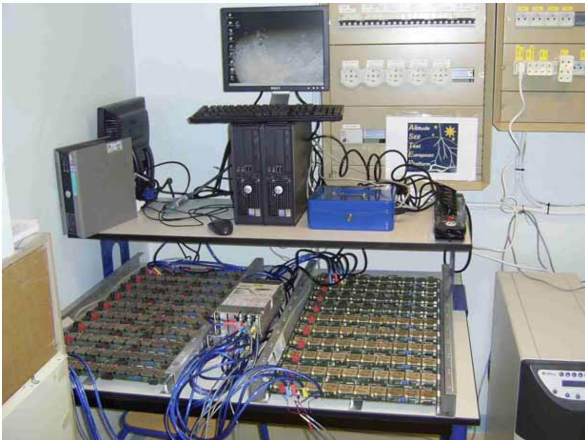
Vue d'ensemble du banc de test Rosetta installé dans le local POM2 de l'Observatoire du Plateau de Bure à 2552m d'altitude.