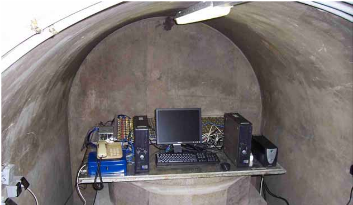
Vue d'ensemble du banc de test Rosetta installé dans une cavité en béton armé de la galerie de secours du LSBB, à exactement -550m de roche calcaire.