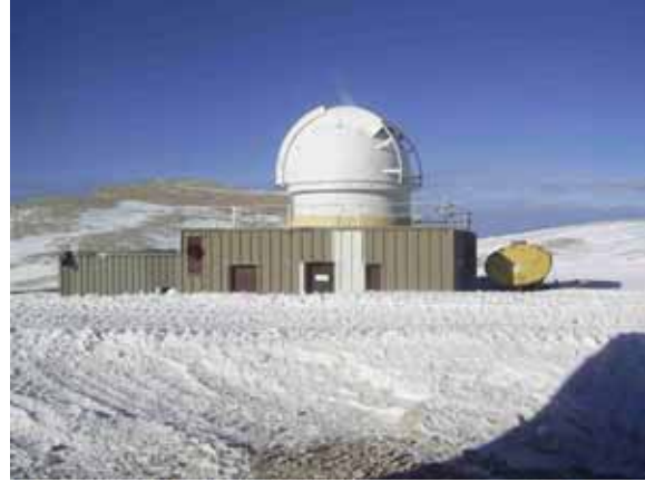
Vue enneigée du Plateau du Pic de Bure et des installations de l'IRAM (à gauche). Vue générale du bâtiment POM2 abritant l'expérience Rosetta (à droite).